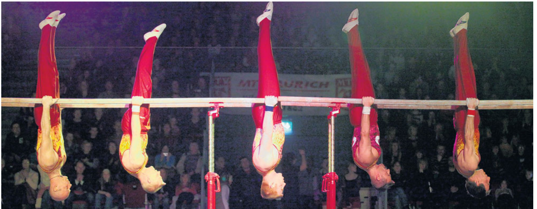
Die Männer-Turnriege des MTV Wittmund gab einen Einblick ins Geräteturnen und stand dabei am Barren auch Kopf.