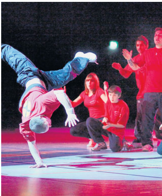
Die Break-Dancer des ISV Emden zeigten ihr Können.

Mitgewirkt haben: TV Leer (Rope Skipping); ISV Emden (Breakdance); Hendrik Stehlik (Trampolin); Heselers SV (Einrad); SV Hage (Turnen Schwebebalken, Barren), MTV Wittmund (Minitrampolin, Geräteturnen Männer und Jungen); MTV Aurich (Behindertensport, Tanz-Show-Gruppe, Turnen Mädchen, Geräteturnen Männer und Jungen); Young Power Generation Oldenburg; New Power Generation Oldenburg (Turnakrobatik); Pakeha Hannover (Lichtjonglage); Emden TV (Turnen), VfB Rajen (Kindertanz), Battle Aps Hannover (Breakdance), TV Bunde (Einrad-Gruppe Akeitu).